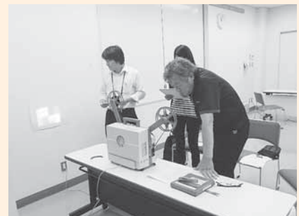
▲7月23日に開催した16ミリ映写機操作技術講習会

※16ミリフィルムとは、フィルムの横幅が16mmの映画用フィルムのことです。 ※教材の貸し出しには一定の条件があります。詳細についてはお問い合わせください。