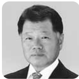
うたがわ とくお 涌谷町長 遠藤 釈雄