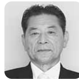
いりま りえつ 色麻町長 早坂 利悦